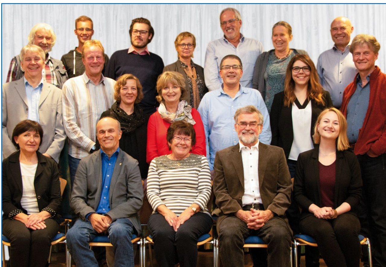
„Auf ein gutes Neues“ und den besten Wünschen für ein gesundes Neues Jahr 2020

hat. Damit diese Tendenz anhält, wird sich die WBH bei der Gemeinderatswahl am 15.03.2020 wieder mit einer Liste von 20 Kandidatinnen und Kandidaten zur Wahl stellen.