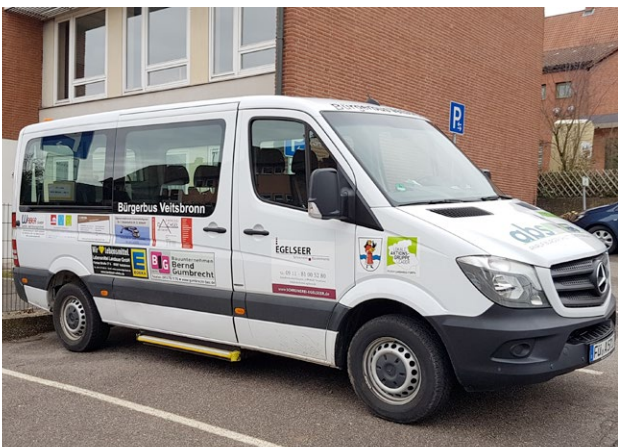
Der Bürgerbus, eine Idee der WBH, verhilft besonders Seniorinnen und Senioren zu einer neuen Lebensqualität.

Der demografische Wandel ist auch in unserer Gemeinde deutlich erkennbar. Aufgrund der immer noch ansteigenden Lebenserwartung steigt auch die Zahl der Seniorinnen und Senioren. Eine Gemeinde muss sich bei ihrer Zukunftsplanung darauf einstellen und auch Strukturen schaffen für unsere älteren Mitbürgerinnen und Mitbürger. Durch eine gute und kluge Zusammenarbeit aller Fraktionen ist es gelungen, für alle Altersgruppen, ange-